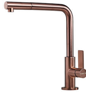
VELA PLUS COPPER satinado 8498 128