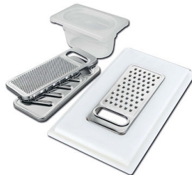
Kit rallador con soporte para anillo y bandeja de recogida de alimentos