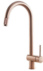
VOLTA COPPER 8491 108