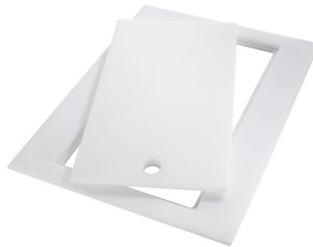
Tabla de corte Twin in HDPE