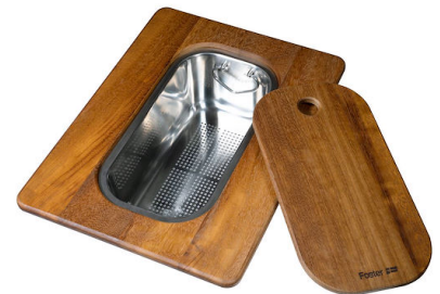
Tabla de corte Twin de madera iroko con escurridor de pasta en acero inoxidable

* sólo en combinación con el accesorio 8644 101