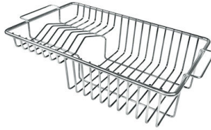
Cesta portaplatos inox

* sólo en combinación con el accesorio 8644 101