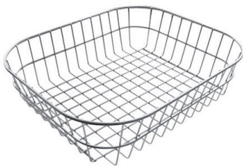
Cesta blanca de acero inoxidable

* sólo en combinación con el accesorio 8644 101